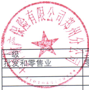
企财险适用行业表